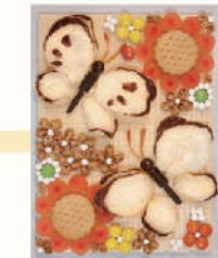
꽃과 나비 꿀라주