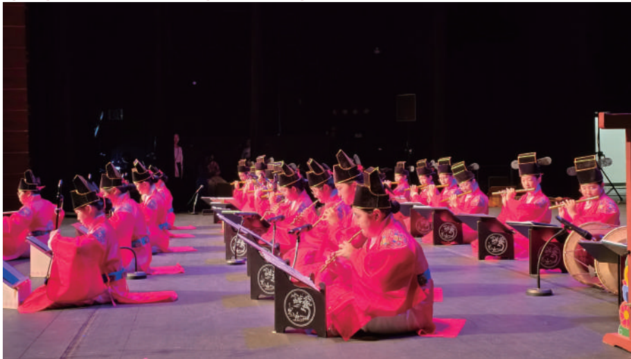
[공연시간 : 6분]