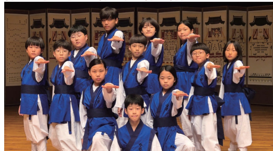
[공연시간 : 9분]