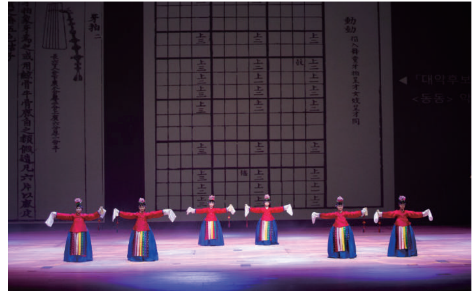
[공연시간 : 6분 40초]

아박무 송파중 2 장연우 영풍초 6 최어등 인천상아초 5 권사랑 인천구월초 5 이서빈 향발무 위례중앙초 4 이효림 거원초 4 홍수연 영풍초 4 송시온 3 이서희