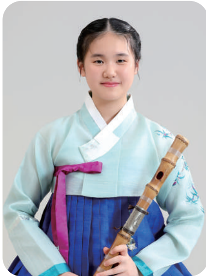
[공연시간 : 5분 30초]

크라운해태가 후원하는 [한음(국악)꿈나무 경연대회], [모여라!! 한음(국악)영재들]에서 수상한 국악영재들에게는 [영재한음(국악)회] 공연에 참여할 기회를 제공합니다.